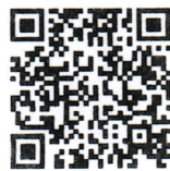
作業療法室紹介動画 Web文化祭2020はこちら