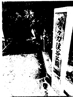
◇ 参加メンバーの声

▽ 深大寺コースでは、雨予報にも関わらず、晴れ男暗れ女メンバーのおかげで天気に恵まれました。名物の蕎麦に舌鼓を打ち、植物公園での観賞に癒されました。