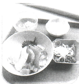
1月行事食『ぜんぶマグロ』

安心・安全な給食提供はもとより、身の健康にも貢献できるような、スタッフと一緒に取り組んで参ります。