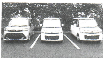
全4台で訪問しています!

訪問を終えて車内に戻ると、まるでサウナ。次の目的地へ到着する頃に、ようやく冷えてくるのですが、再び車へ戻ると、その連続です。今夏から支給された保険割タイアの「ネククラー」が欠かされていません。