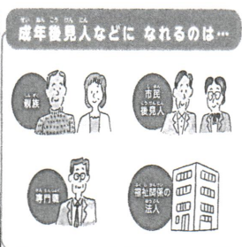
誰がなるかは、あなたの希望や気持ち、からだの様子、暮らし方を確かめてあなたに合った人を 家庭裁判所が きめます。

誰でもなり得ます。親族や親戚、身近な頼れる人の場合もありますし、福祉や法律の専門家や法人や団体の場合もあります。誰がなるのかは、ご自身に合った人をご家庭裁判所が決定します。そのため、どんな後見人が良いかを