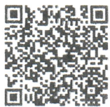
成年後見制度の紹介動画