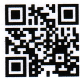
病棟紹介動画はこちらから

また、病棟内では、チーム医療プロジェクトや作業療法等の様々なプログラムを定期的で開催し、退院に向けた取り組みを行っています。